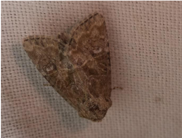
7 augustus 2020