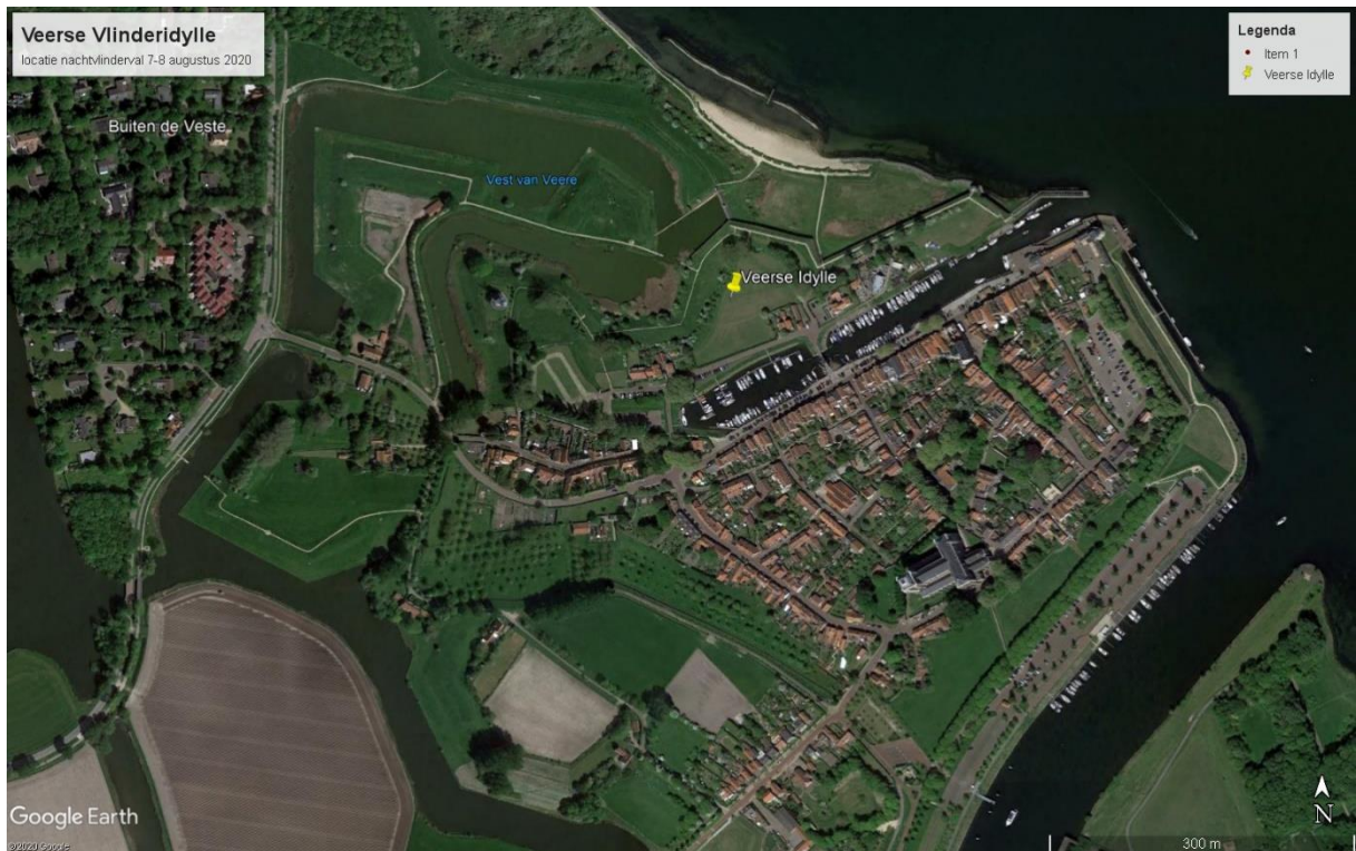
Situering van de locatie in van Veerse vlinderidylle aan het Bastion