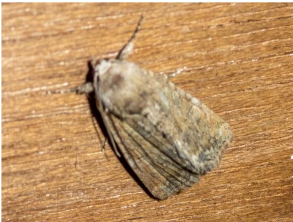
8 augustus 2020