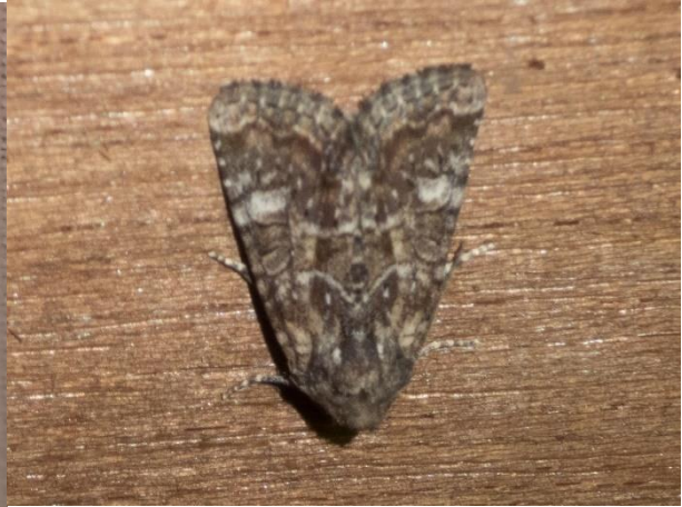
8 augustus 2020