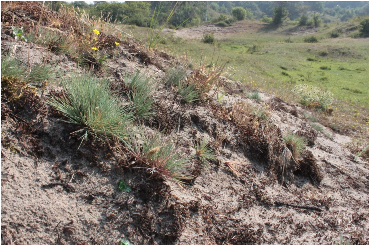
Cruciaal voor de heilvinder is de beschikbaarheid van voldoende voortplantingsbiotopen. Dat zijn schrale duintjes met voldoende waardplanten voor de rupsen: in dit geval voornamelijk polletjes buntgras.