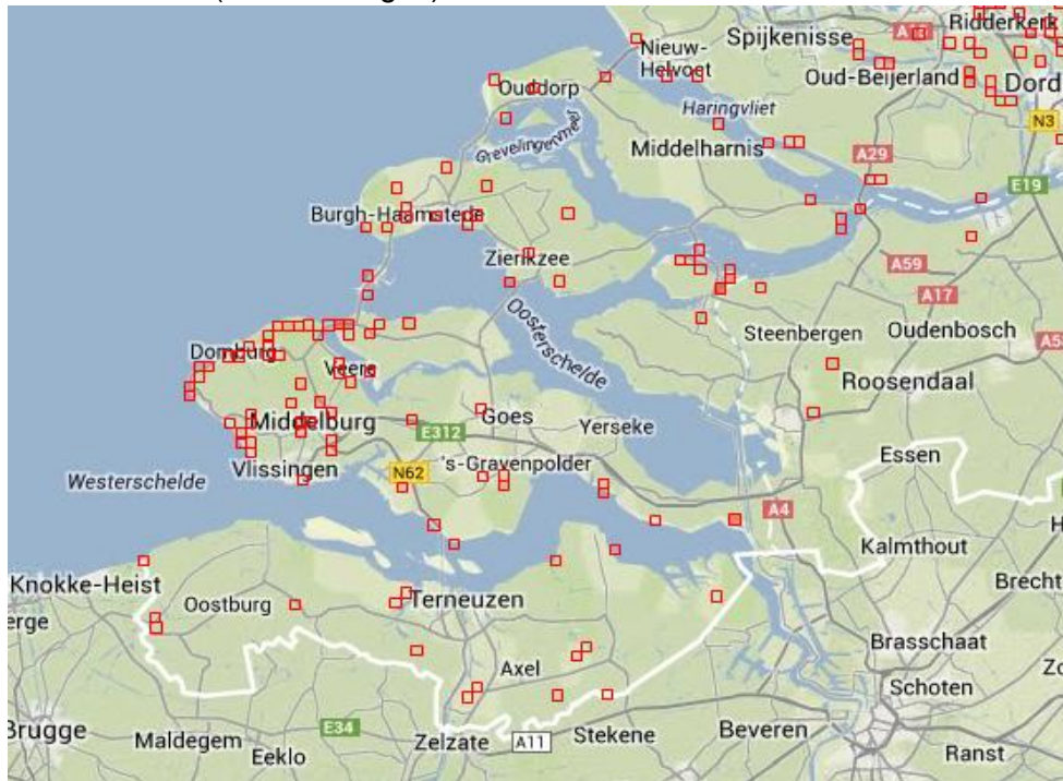
Verspreiding bruin blauwtje 2013

Hieronder aangegeven twee verspreidingskaartjes van waarnemingen bruin blauwtje in 2013 en 2014 (waarneming.nl).