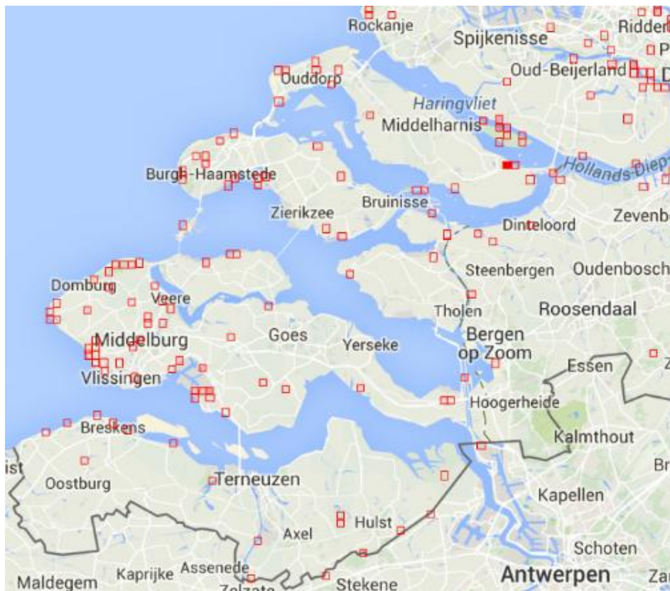
Verspreiding bruin blauwtje 2014